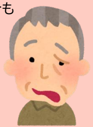
顔面麻痺になると大変！

11月1日から宇都宮市でも带状疱疹のワクチンが助成対象となります。対象は50歳以上。带状疱疹の原因は水疱瘡と同じウィルスで、免疫力の低下に伴い再活性化することで発症する皮膚病です。体の左右どちらかの神経に沿って赤い斑点と水泡が集まって帯状となり、ピリピリと刺すような痛みを伴います。痛みは徐々に増し、眠れないほどの激しい痛みが出る事もあります。50歳～80歳までに3人に1人が発症すると言われており、高齢者は痛みを感じにくい場合もありますが、ただの皮膚病ではありません。神経の集中している足や顔面に出来ると痛みが強く何か月も歩けなかったり、顔面麻痺で苦しんだりする場合があります。施設では1年に4～5人発症しています。ワクチンは5年か10年有効のもの2種類で、それぞれ費用や副作用に差があり10年のタイプは2回接種する必要があります。詳しくは、宇都宮市のホームページ(ページID1033175)をご覧ください。施設でも接種を検討いたしますが、インフルエンザ、新型コロナのワクチン接種を11月、12月に行うため、時期をずらすことになると思います。ご希望の方は、健診の際等で接種可能ですのでご相談ください。尚、過去に接種した带状疱疹ワクチンの償還払い助成は対象にならず、11月以降に接種した場合のみだそうです。ご家族様もまた、接種をご検討ください。