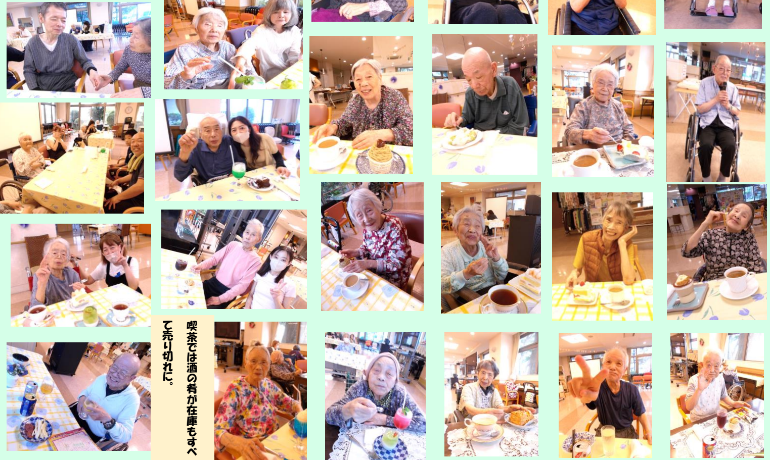
喫茶では酒の肴が在庫もすべて売り切れに。