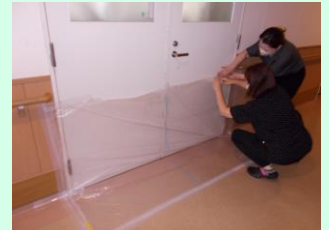
令和元年の台風 19 号で浸水した様子。 ↑ 洗日の防災訓練の様子。台風前日に施行