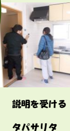
説明を受ける タバサリタ

4月に入る新卒ニパール 人介護士達が住む物件探 し中。十軒電話しすべて 断られる厳しい部屋探 し。三軒はご成約、あと二 部屋…安くて風呂とトイ レが別、施設に超近いと こが見つかりますように。