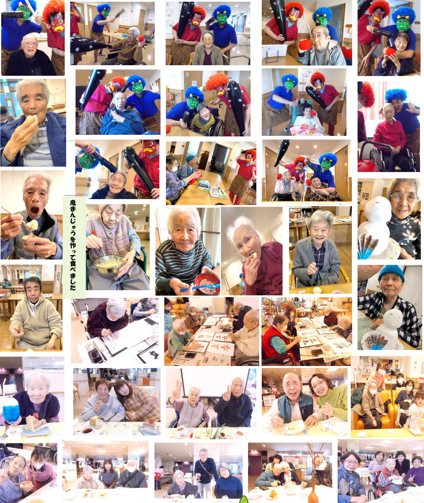
鬼まんじゅうを作って食べました