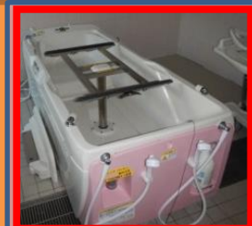
機械浴槽を新しくしました

平成 21 年から使用している機械浴槽も 10 年が経過し、不具合や部品確保も難しくなったことから、設備更新が必要となりました。今回は東京都共同募金会より助成を受け、8 月より新しい機械浴槽に入れかえる事が出来ました。