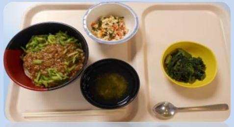
6月岩手郷土料理 ジャージャー麺