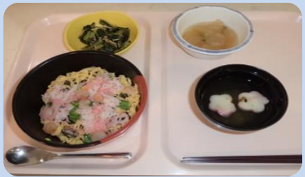
5月岡山郷土料理 岡山飯